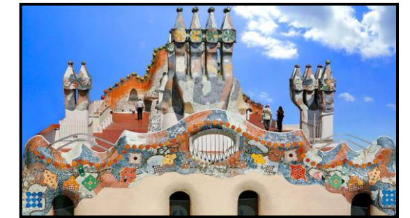
La azotea y las chimeneas