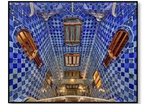
El patio interior