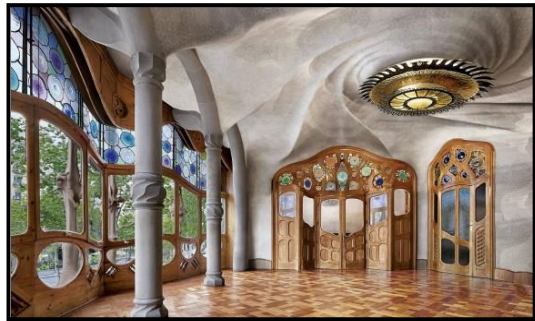
El salón principal