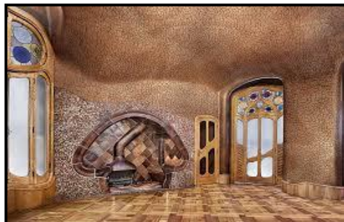
La sala de la chimenea