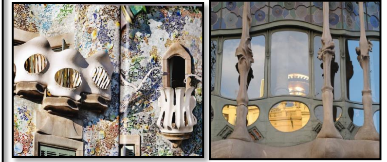
La fachada, los balcones y las columnas