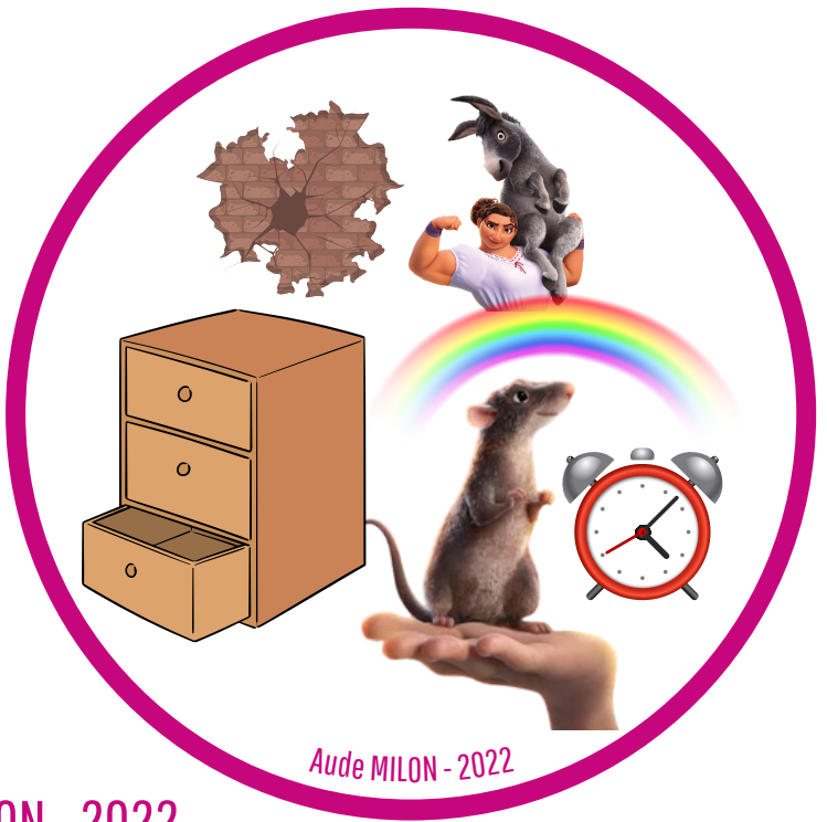
Aude MILON - 2022