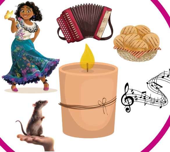
Aude MILON - 2022