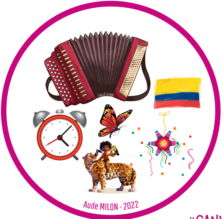
Aude MILON - 2022