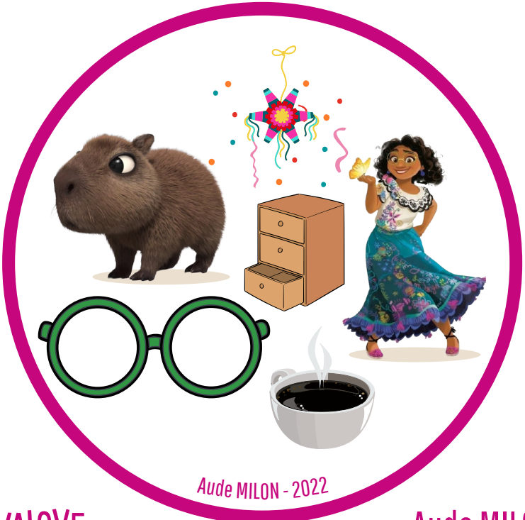
Aude MILON - 2022