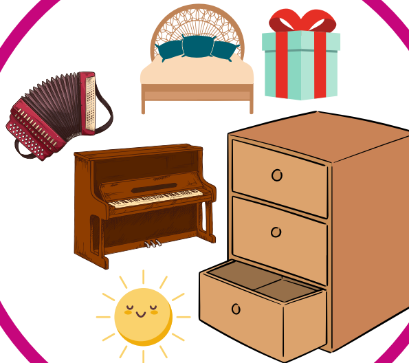
Aude MILON - 2022