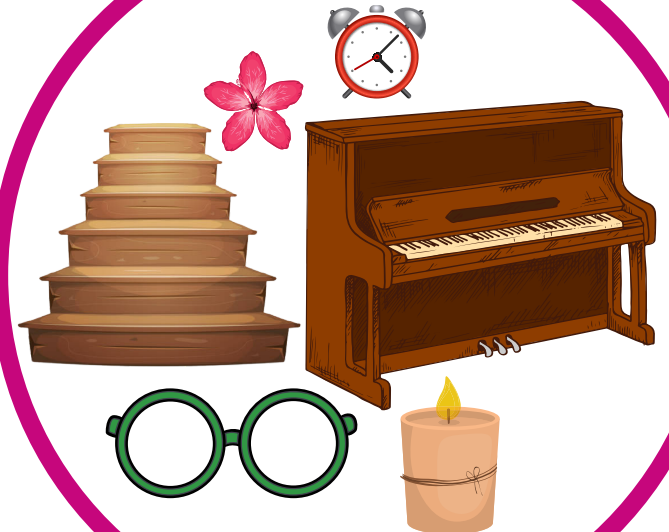
Aude MILON - 2022