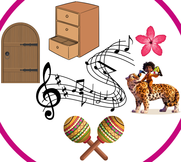
Aude MILON - 2022