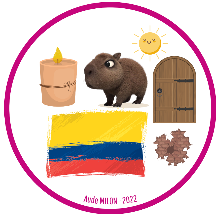
Aude MILON - 2022