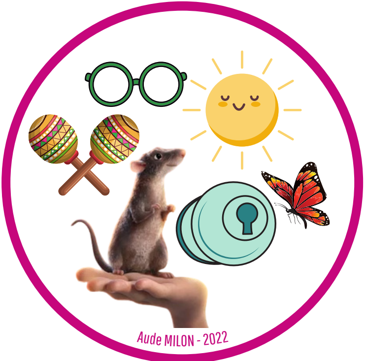
Aude MILON - 2022