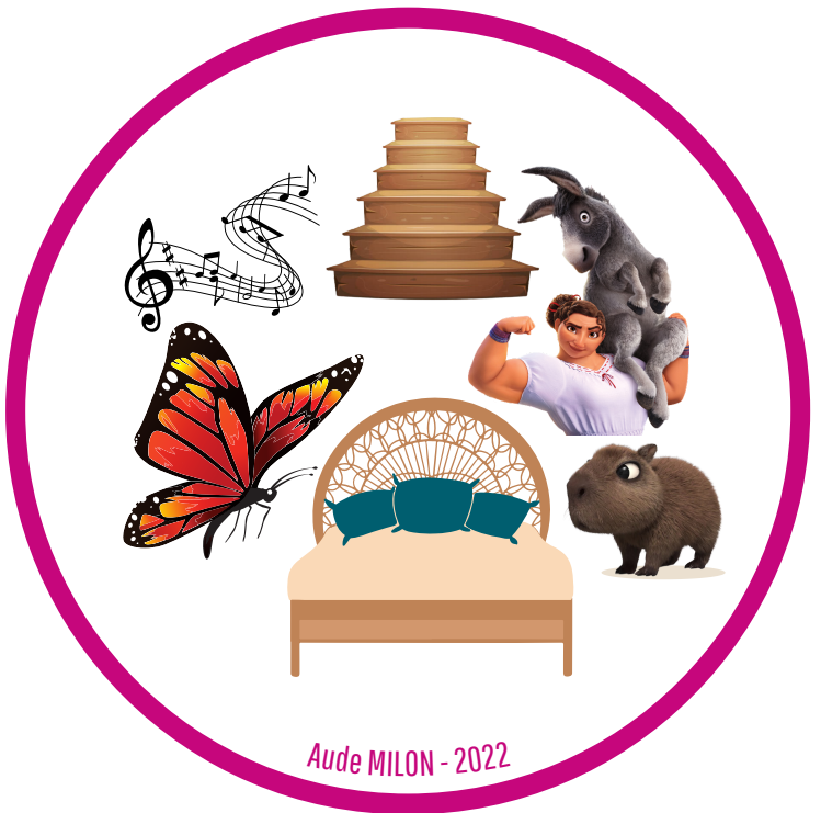
Aude MILON - 2022