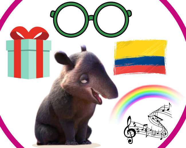
Aude MILON - 2022