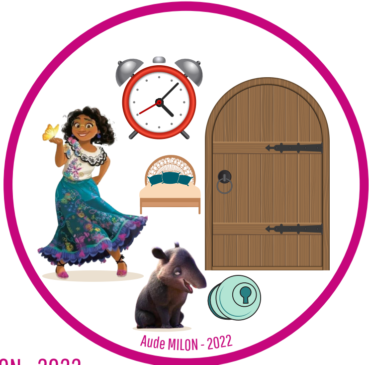
Aude MILON - 2022