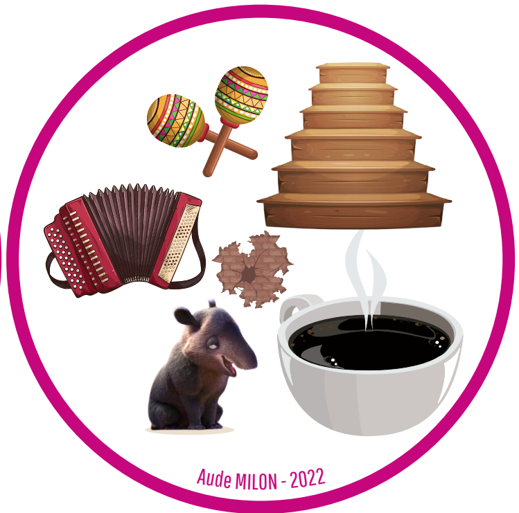
Aude MILON - 2022