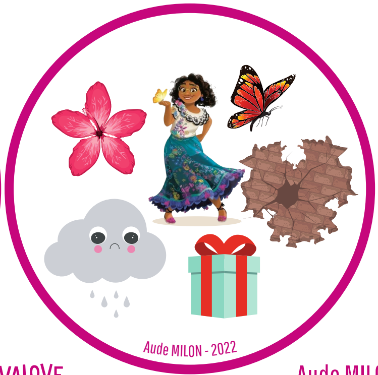
Aude MILON - 2022