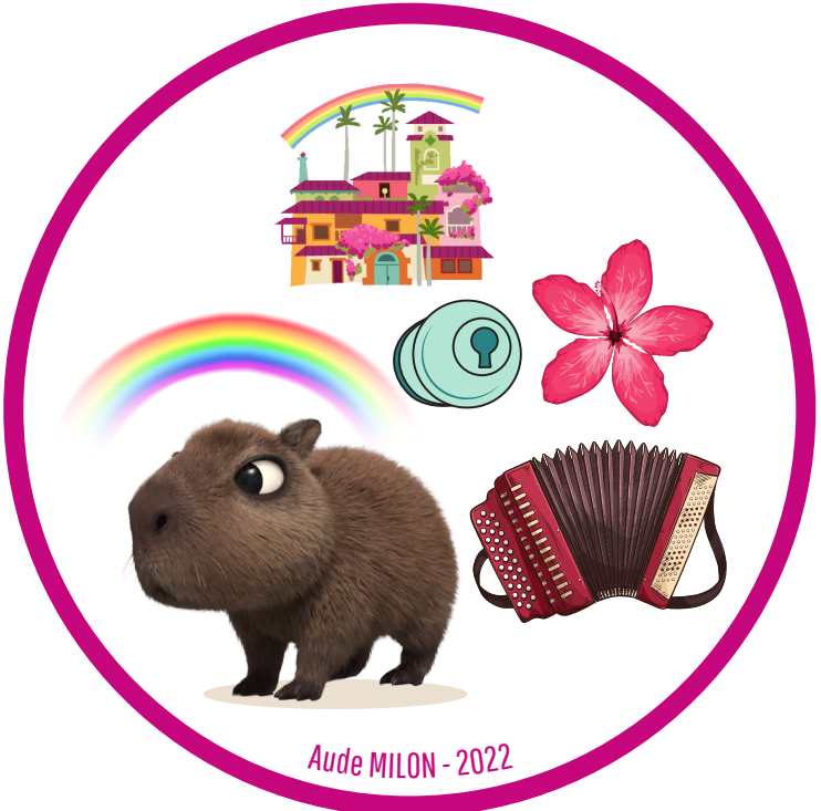
Aude MILON - 2022