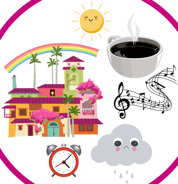
Aude MILON - 2022