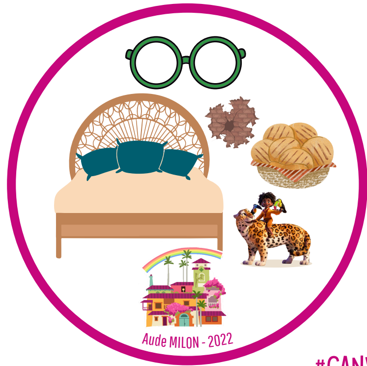
Aude MILON - 2022