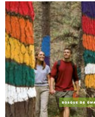
BOSQUE DE OMA

En las inmediaciones podrás disfrutar de paseos por la playa de Laida , la más grande de la zona, con casi un kilómetro de arena fina y dorada. Un lugar ideal para el baño infantil por sus aguas poco profundas. Muy cerca tienes la playa de Laga , junto al Cabo de Ogoño , con uno de los arenales más bellos de la Costa Vasca. Sus olas atraen a amantes del surf y otros deportes acuáticos, como la vela o el piragüismo. También te gustará contemplar las vistas del mar que te ofrece la Ermita de San Juan de Gaztelugatxe . Otra opción es perderte por senderos y llegar al bosque de Oma , en el que Agustín Ibarrola se sirvió de la pintura en los árboles para crear una obra de land-art en un espacio ciertamente encantado.