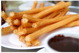
Churros con chocolate