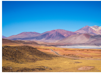
Desierto de Atacama