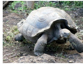
Tortugas de las Islas Galápagos