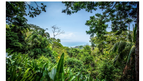
Parque natural del Corcovado